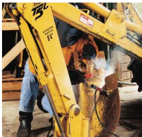
Soldadura de Electrodo Revestido con CA